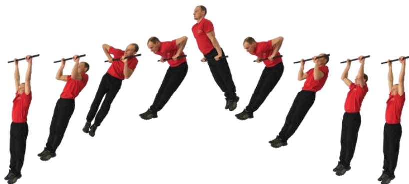
Рис. 3. Подъем силой на перекладине