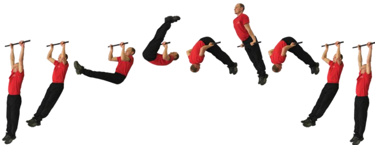
Рис. 2. Подъем переворотом на перекладине