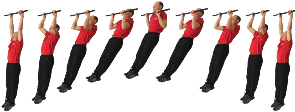
Рис. 1. Подтягивание на перекладине