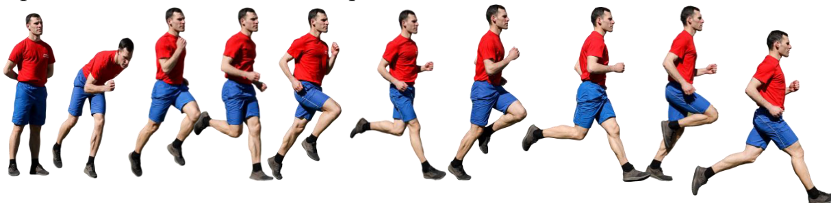
Рис. 7. Бег на 1 км, бег на 3 км.

Старт и финиш, как правило, оборудуются в одном месте. При выполнении упражнений на беговой дорожке стадиона старт и финиш производится в соответствии с разметкой стадиона.