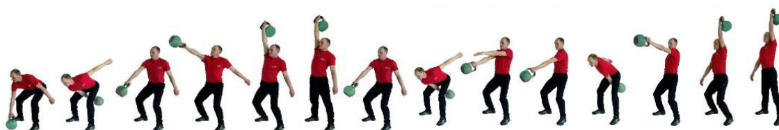
Рис. 4. Рывок гири

При нарушении условий выполнения упражнения повторение не засчитывается, подается команда «НЕ СЧИТАТЬ».